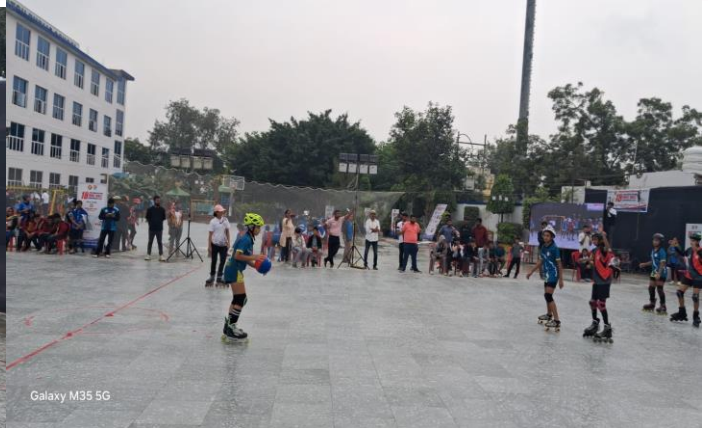
Galaxy M35 5G