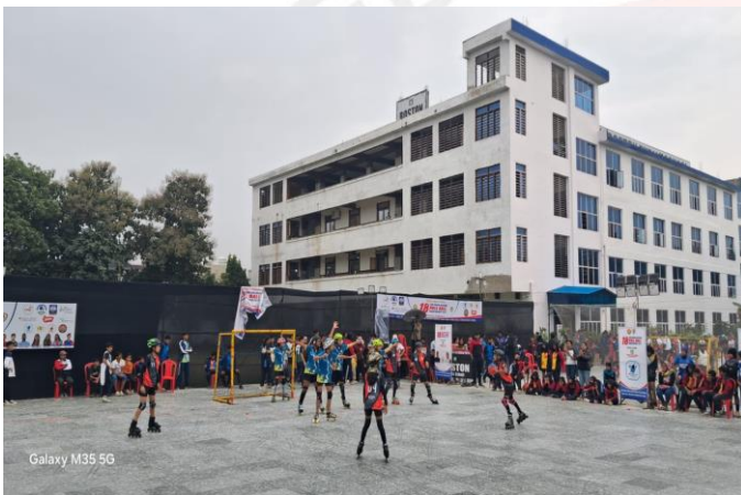
Galaxy M35 5G