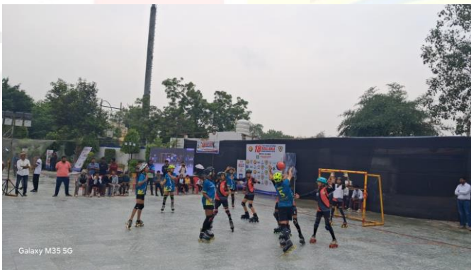
Galaxy M35 5G