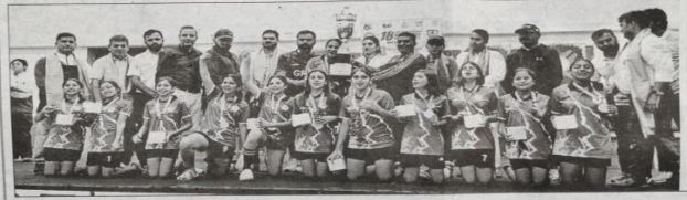
हरियाणा के खिलाड़ियों का फोटो

रोल बॉल फेडरेशन ऑफ इंडिया की तरफ से आयोजित 18वीं सब-जूनियर (अंडर-14) रोल बॉल राष्ट्रीय प्रतियोगिता जो कि 25 अक्टूबर से 28 अक्टूबर तक आगरा के बोस्टन पब्लिक स्कूल आगरा उत्तरप्रदेश में सम्पन्न हुई थी।