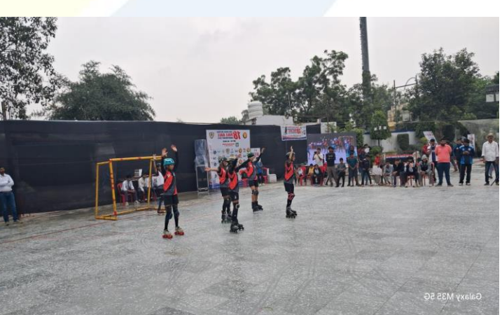
Galaxy M35 5G