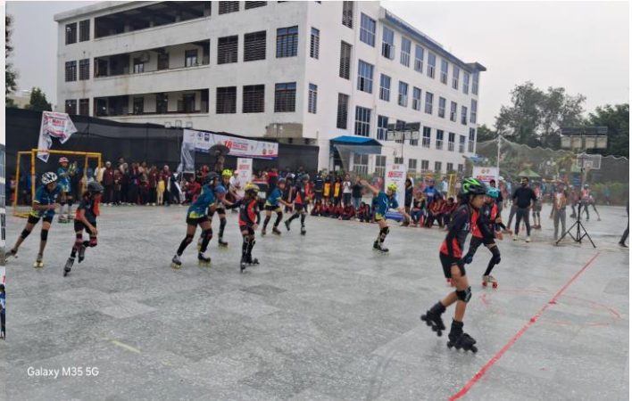
Galaxy M35 5G