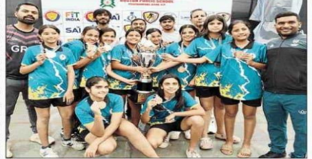
विजेता खिलाड़ी अपने पदकों के साथ।

सोनीपत, 30 अक्टूबर (न्यूरो) : आगरा रोल बॉल एसोसिएशन और रोल बॉल फेडरेशन ऑफ इंडिया की ओर से आयोजित 18वीं सब-जूनियर (अंडर-14) राष्ट्रीय रोल बॉल प्रतियोगिता 25 से 28 अक्टूबर तक बोस्टन पब्लिक स्कूल, पश्चिमपुरी रोड, आगरा में सम्पन्न हुई। इस प्रतियोगिता में हरियाणा की लड़कियों की टीम ने शानदार प्रदर्शन करते हुए स्वर्ण पदक अपने नाम किया, जबकि लड़कों की टीम ने भी बेहतरीन खेल दिखाकर राज्य का मान बढ़ाया। देशभर के 21 राज्यों की टीमों ने भाग लिया। पूल ए में हरियाणा की लड़कियों की टीम ने वेस्ट बंगाल को 8-0, असम को 4-3, महाराष्ट्र को 4-1, आर.एस.एस. टीम को 3-1 और मणिपुर को 8-2 से हराकर क्वार्टर फाइनल में प्रवेश किया।