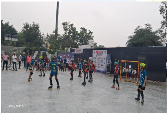
Galaxy M35 5G