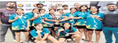
ट्रॉफी प्राप्त करते हुए हरियाणा की टीम।