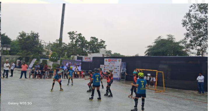
Galaxy M35 5G