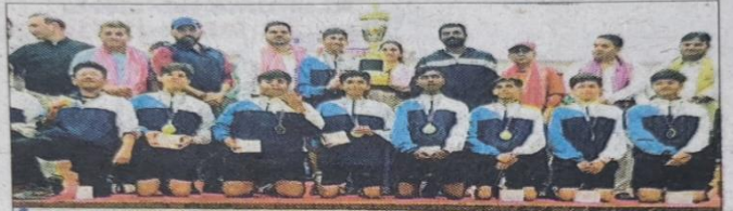
राष्ट्रीय रोलबॉल में बालक वर्ग का खिताब जीतने वाली यूपी टीम। - आयोजक

लखनऊ। उत्तर प्रदेश की बालक टीम ने सब जूनियर नेशनल रोलबॉल चैंपियनशिप में राजस्थान को हराकर चैंपियन बनने का गौरव हासिल किया। आगरा में आयोजित की गई चैंपियनशिप में उत्तर प्रदेश गर्ल्स बालिका टीम उपविजेता रही।